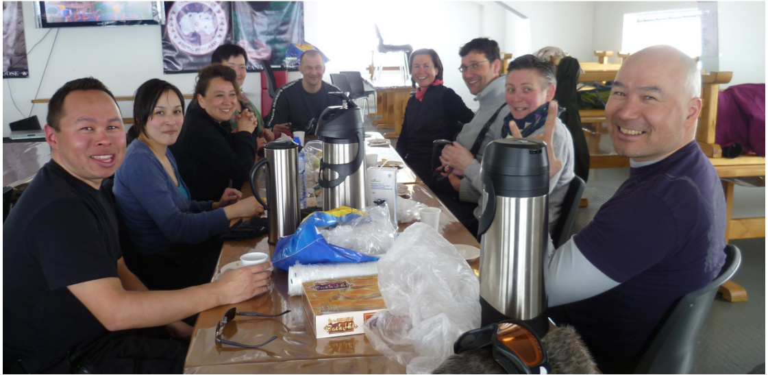
Sæsoni naakkaluartooq sisorartarfimmi ulloq sisorarfik angumeraarput